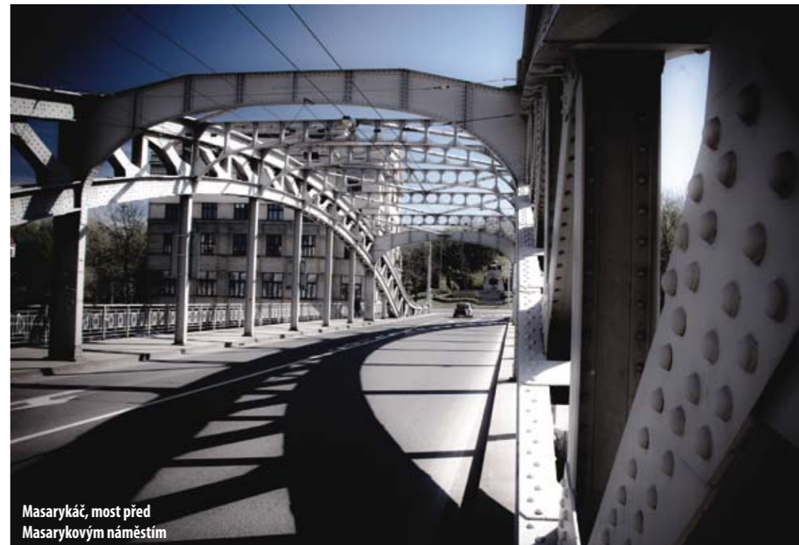
Masarykáč, most před Masarykovým náměstím

Zevrubnější pohled pod smogovou pokličku mu dává naději. Vedle oficiálních projektů podporovaných nejrůznějšími institucemi a městským rozpočtem se „černá perla“ blýská leštěná dechem nikde neorganizovaných nadšenců a zatvrzelých patriotů. Ocelové město je magnetem, oni železnými pilinami.